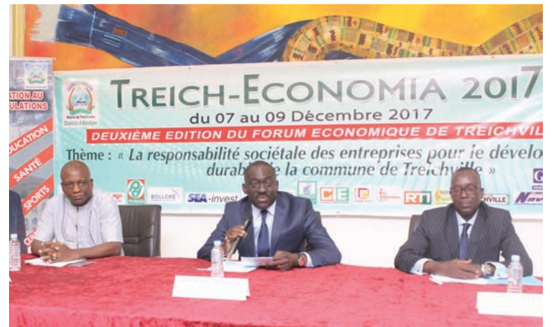
Le 1 er Adjoint au Maire (au centre), le Commissaire général (extrême droite) et son adjoint ont édifié les journalistes.

en prélude à la 2 ème édition de Treich Economia parrainée par Adama Koné, Ministre de l'Economie et des Finances a, pour ainsi dire, drainé du monde. Rendez-vous est donc pris du 7 au 9 décembre 2017 au Rond point de la Rue 12 pour vivre l'évènement dans toute sa grandeur ■