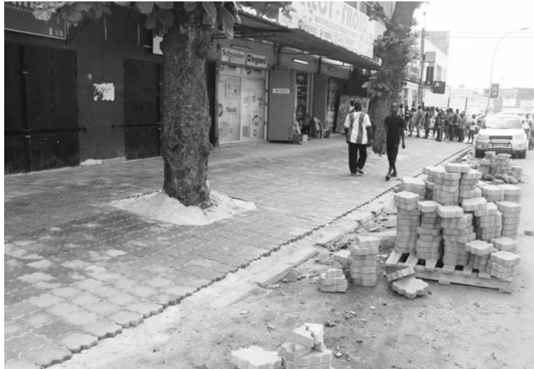
Les trottoirs de la rue 12 ont fière allure.

Les trottoirs de la mythique rue 12 seront redorés par des pavés. C'est depuis le lundi 23 octobre 2017, que la Direction des Services Techniques et de l'Environnement (DSTE) a lancé les travaux de pavage des abords de cette rue commerciale. De l'avenue 21 jusqu'à la Garde Républicaine, voire l'avenue 1, ce sont au moins cinq (5) kilomètres, qui seront ornés par des pavés d'ici fin novembre 2017 pour accueillir la 2 ème édition du forum économique: Treich-économie. L'éclairage de cette rue sera réhabilité. «Le Conseil municipal remplacera les lampadaires par des candélabres», a dit, à ce propos, Ahissi Agovi Jérôme, 1 er Adjoint au Maire, le jeudi 26 octobre 2017 lors de la 3 ème réunion du Conseil municipal. L'apport des commerçants de cette rue est à noter. «Ils ont pris sur eux la charge d'installer des stores uniformes», a précisé le 1 er Adjoint. En attendant le ravalement des façades des magasins de ladite rue, qui constituera le pinceau final d'un pan du projet d'embellissement, on peut observer, que le tra-