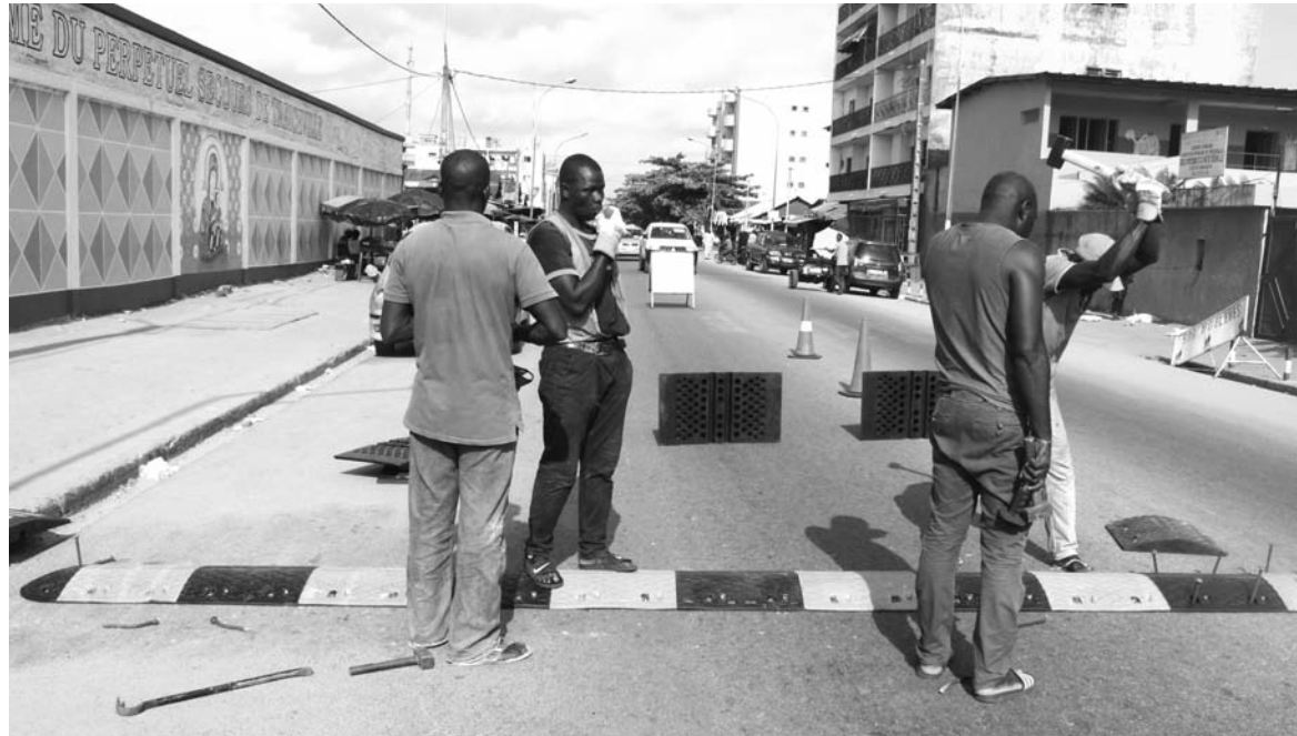
Les nouveaux ralentisseurs de vitesse vont réduire les accidents de la route.