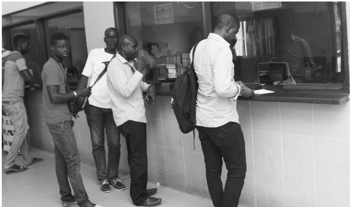
... les réquerants en leur évitant une longue attente, grâce à la signature disponible au quotidien de ...