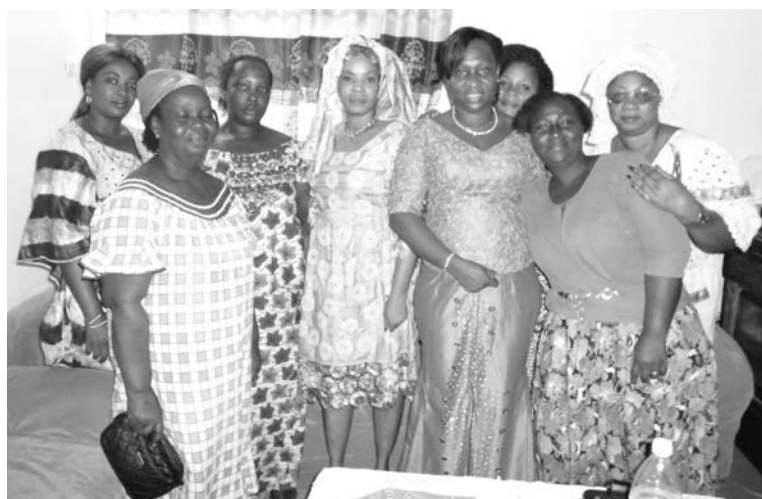
Ces femmes déjà mobilisées pour le don de sang en novembre.

avons instauré une tontine. Nous soutenons nos membres par des prêts, levons des cotisations et leur offrons des sacs de riz, des bidons d'huile. Nous prônons aussi notre intégration au sein de la société sénégalaise pour lever tous les préjugés contre les Sénégalais. En plus, nous menons des actions sociales comme le balayage de notre Commune. A cet effet, nous intervenons le 1er samedi de chaque mois dans la rue de chaque membre. Nous serons le 6 novembre 2017 à l'avenue 6. Au niveau social, nous faisons des cadeaux aux enfants pendant la fête de Noël malgré nos maigres moyens. Après 2016, d'autres enfants seront