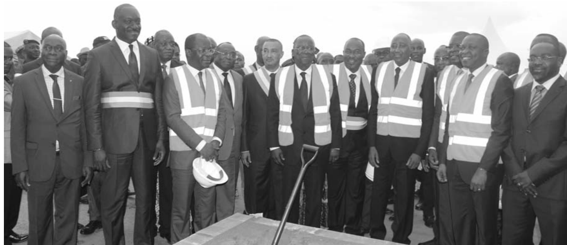
La population et le Conseil municipal ont mérité les honneurs du Premier Ministre.