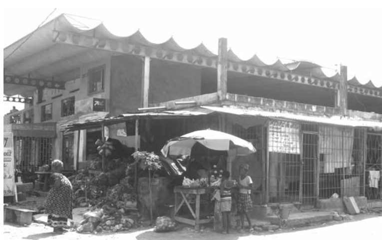
Les commerçants appelés à s'investir dans l'assainissement et la sécurisation de leur lieu de travail.

06 Octobre 2017 des autorités municipales avec des responsables des Forces de l'ordre après la visite dudit marché initiée par Ahissi Agovi Jérôme, 1 er Adjoint au Maire. A lire, à cet effet, l'article intitulé : Situation sécuritaire des commerçants et magasins : Bientôt un poste de police au marché de Belleville. Outre ce poste, il a été demandé aux commerçants de trouver eux-mêmes des agents de sécurité pour une surveillance permanente. Quant au marché du port de pêche, il y a été constaté, qu'après la visite du Maire Ahissi Agovi Jérôme, le jeudi 02 février 2017, qu'en plus du problème de sécurité et de commodité aux alentours, l'irrégularité de la collecte et le ramassage des ordures ne cessent de causer une forte odeur. La réhabilitation partielle ou totale du marché aux poissons, le déguerpissement des alentours du marché, la destruction des baraques frigorifiques ont été souhaités. Au