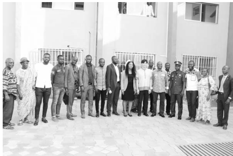
Les jeunes ont adhéré à l'initiative de l'Ong Mérite International de la jeunesse.