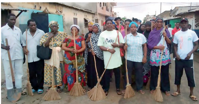
Cette action citoyenne est à suivre.