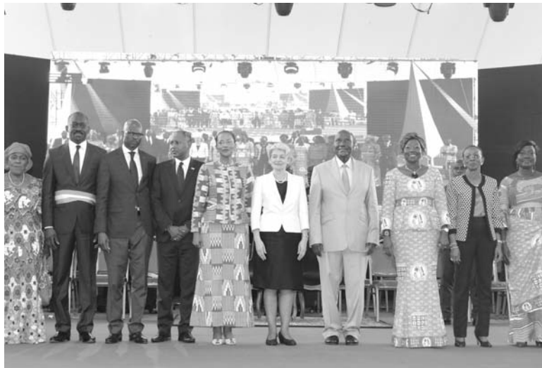
Le Vice-Président, les Ministres, la Directrice générale de l'UNESCO, Irina Bokova et le 1er Adjoint ont réhaussé l'événement de leur présence.