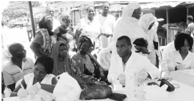
Le Groupement des Accidentés Vasculaires Cérébraux de Côte d'Ivoire en action.

La santé est le plus précieux des biens. A ce titre, elle doit être préservée par tous les moyens. Ne dit-on pas qu'il vaut mieux prévenir que guérir ? C'est dans cette optique que le Groupement des Accidentés Vasculaires Cérébraux de Côte d'Ivoire (GAVCI-CI) a lancé, depuis le samedi 7 Octobre 2017, dans la Commune de Port-Bouet, la deuxième édition de la caravane de sensibilisation et de dépistage du Diabète et de l'Hypertension artérielle. Celle-ci est sensée sillonner les 13 Communes du District Autonome d'Abidjan. A cet effet, le jeudi 26 octobre 2017, sous la houlette de la Direction des Services Socioculturels et de Promotion Humaine de la Mairie de Treichville, une journée de sensibilisation a été organisée au quartier Yobou Lambert (Ex-Biafra). Pour le plus grand bonheur des organisateurs, les populations sorties nombreuses n'ont pas boudé leur joie de se faire dépister. « Contrairement à l'édition précédente, nous avons décidé d'aller vers les populations. Nous