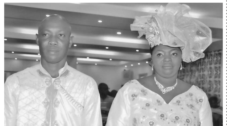
Longue vie et amour au couple Adjoumani