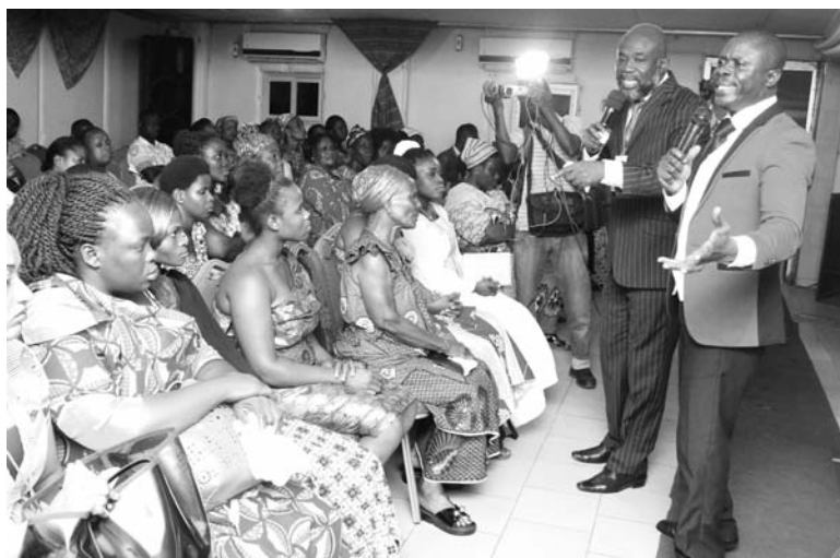
Des enseignements ont été donnés par les Pasteurs aux fidèles chrétiens.

A l'occasion de la 8 ème Convention Internationale de la Mission Evangélique "Faith and Love" qui s'est déroulée du Mercredi 04 Octobre au Vendredi 06 Octobre 2107 au Temple Canaan de Treichville, d'éminents hommes de DIEU, venus de l'intérieur du pays et de la sous-région, ont répondu favorablement à l'invitation du Pasteur