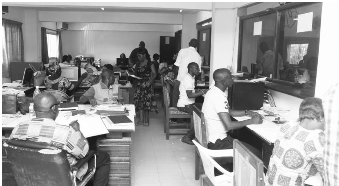
Les agents de la sous-direction de l'état civil toujours déterminés à servir...

La sous-direction de l'état civil est composée de quatre (4) sections. A savoir la Section Naissance, la Section Mariage, la Section Décès et la Section Autres que. La première section s'occupe des déclarations de naissance, de l'établissement et