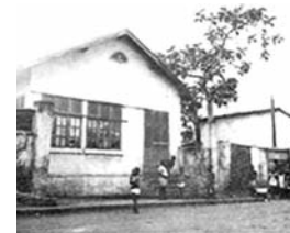
La résidence des DADIE, à l'avenue 4 rue 7, lot 96, le 1er bureau du PDCI à Treichville

● Les "maisons" de la tendre enfance de Hortense DADIE