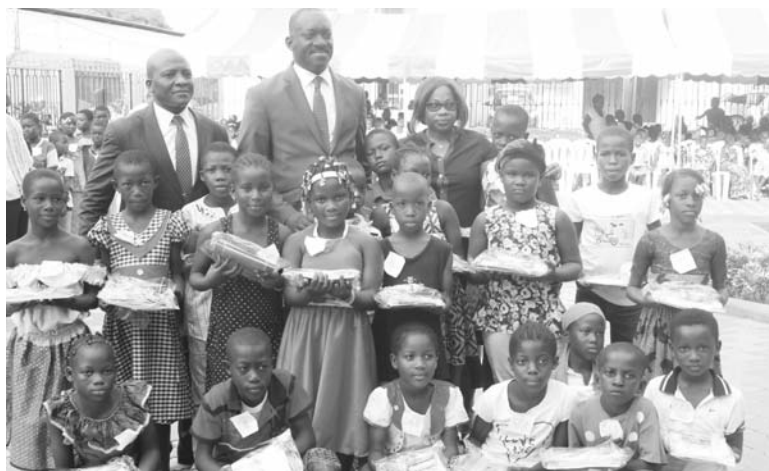
Les enfants sont repartis les bras chargés de kits scolaires.