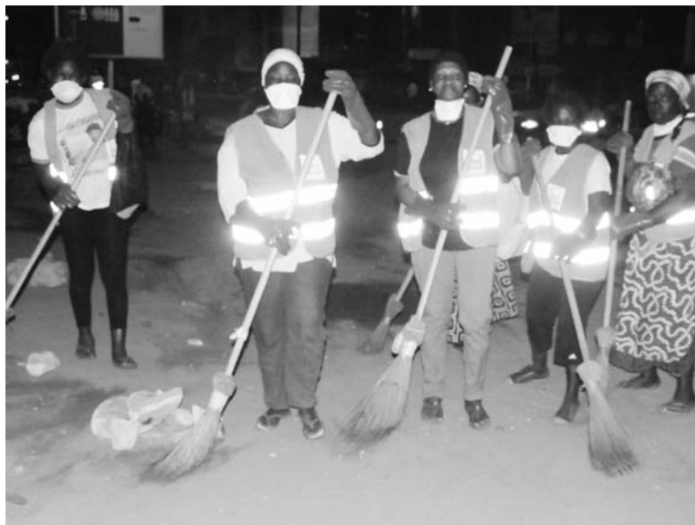
Les équipes de balayage de nuit toujours à la tâche.