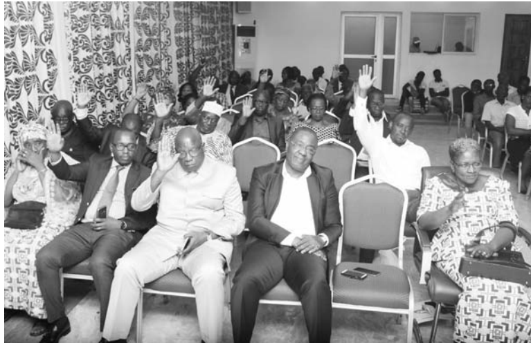
La 3 e réunion du Conseil municipal a tenu toutes ses promesses.