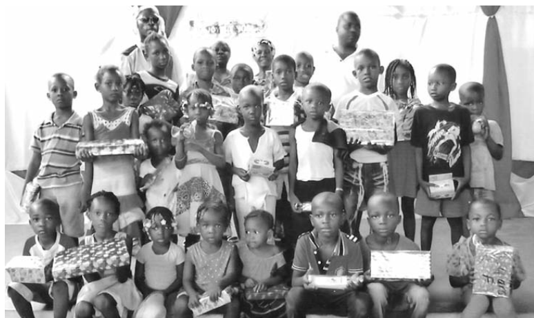
Ces enfants été couverts de cadeaux par l'ensemble artistique Treich n'zassa.

ceux qui en ont besoin. Nous saluons Monsieur le Ministre François Albert Amichia pour tout ce qu'il fait en faveur des