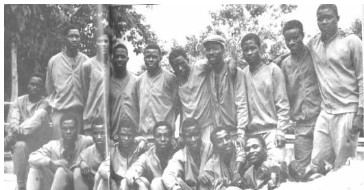
Les héros de Brazzaville

1/2 Finale Côte d'Ivoire (0) - Congo Brazza (1) pays organisateur. Match de classement: Côte d'Ivoire (2) Algérie (0) buts de SYLLA et de MANGLE.