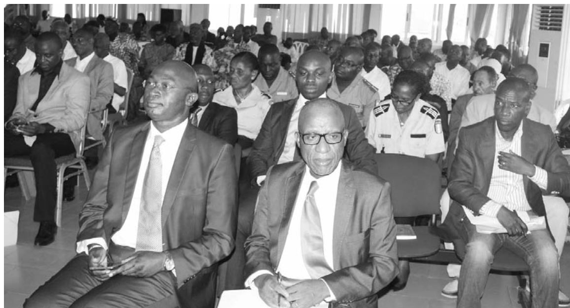
Forte affluence de la population lors du 4 e Conseil Municipal en présence du nouveau DG de la Décentralisation (en première ligne à gauche).