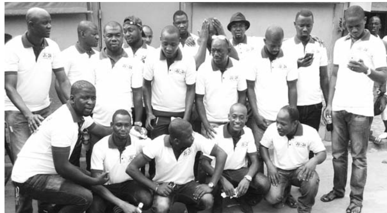
Les jeunes de l'avenue 24 désormais en association.

sident à portée sociale. Dans son allocution de bienvenue, le président a remercié l'assistance pour son soutien sans faille et exhorté les adhérents et les jeunes à l'union pour le bonheur