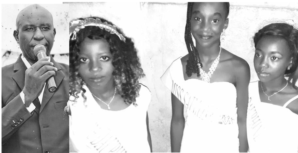
La beauté de la femme africaine a été valorisée par les organisateurs.

Treichville en apportant chacun sa contribution. De mon côté, je fais ce que je peux avec mes