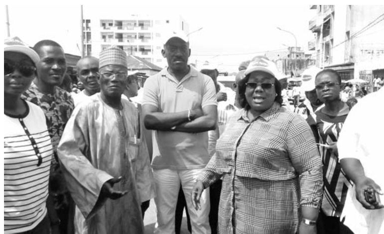
Mme Le Ministre, Anne Désirée Ouloto satisfaite des efforts de Treichville en matière d'assainissement.