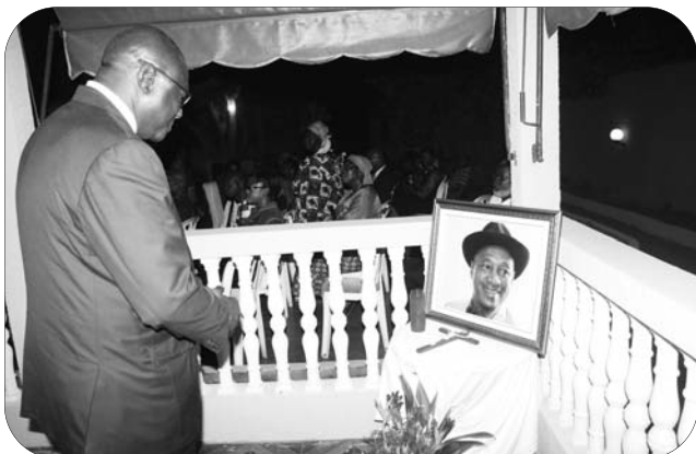
Sensible à la disparition de Laurent Pokou, légende du football ivoirien, François A. Amichia, Ministre des Sports et Loisirs lui a rendu un dernier hommage le mercredi 28 décembre 2016.