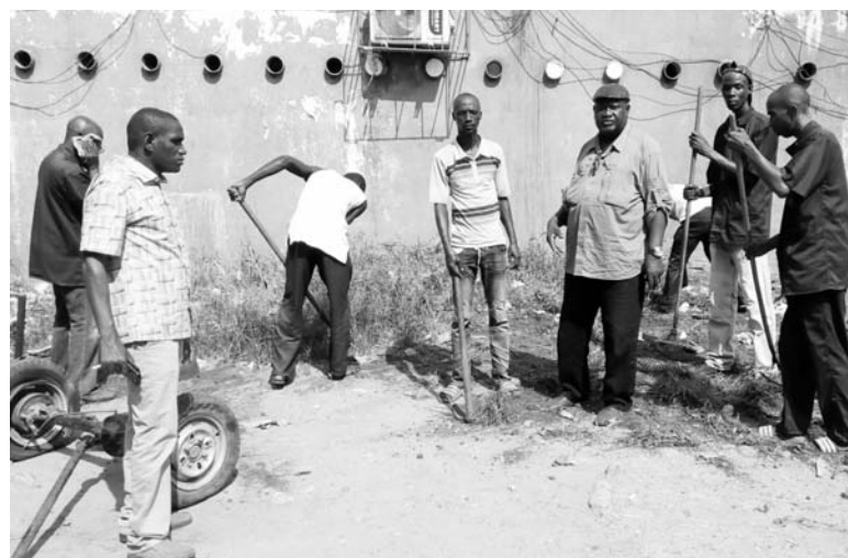
La sous-direction Voirie, Hygiène, Réseau et Environnement (Vrhe) est à pied d'oeuvre sur le terrain.

afin d'assainir toute la Commune. Il s'agit ici de désherber, de rendre les lieux un peu plus propres en dégageant tout ce qui est encombrant, pour le bien des riverains», a ajouté le Chef de Service Voirie. Avant de