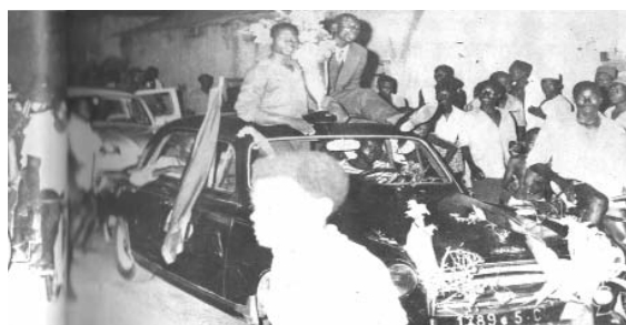
Le retour triomphal des héros de Dakar.

À peine les ex-colonies de la France ont-elles choisi la voie de l'indépendance en 1960 que sous l'impulsion du Général De Gaulle, Président de la République et de Maurice Herzog, son Ministre des Sports, l'alpiniste émérite vainqueur de l'Annapurna, que l'idée de créer des jeux sportifs en Afrique finit par se concrétiser avec la première édition des Jeux de l'Amitié à Tananarive en Avril 1960, la deuxième à Abidjan en Décembre 1961 et la troisième à Dakar en Avril 1963. En fait ces Jeux de l'Amitié étaient un tournoi amical entre les ex colonies françaises d'Afrique.