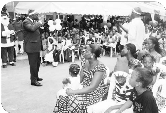
... la commune pour distribuer des cadeaux à tous les enfants. Sans oublier ceux des agents municipaux.